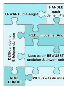
Die Puzzle Teile der Angstbewältigung